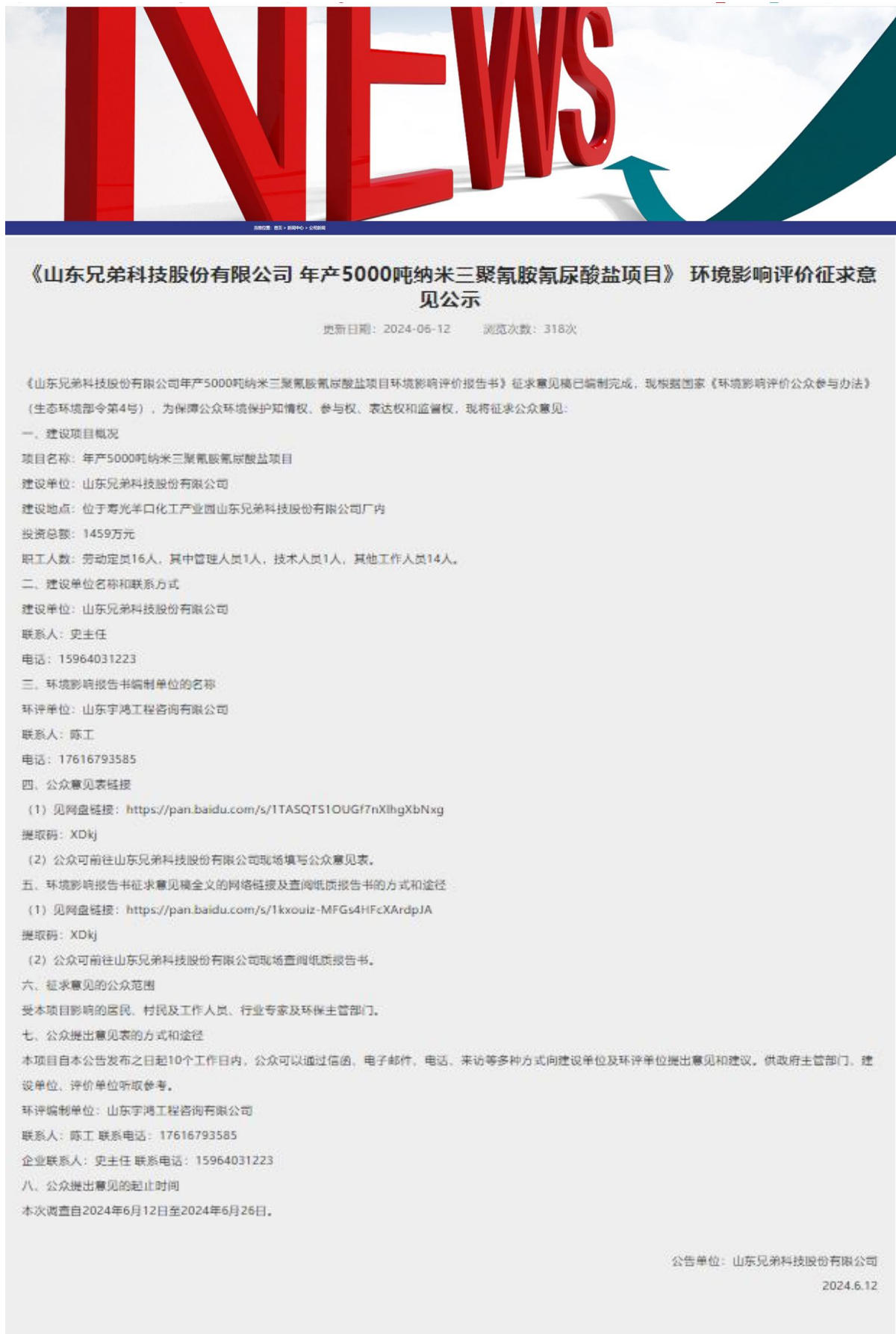
图 3.2-1 网上第二次公示截图