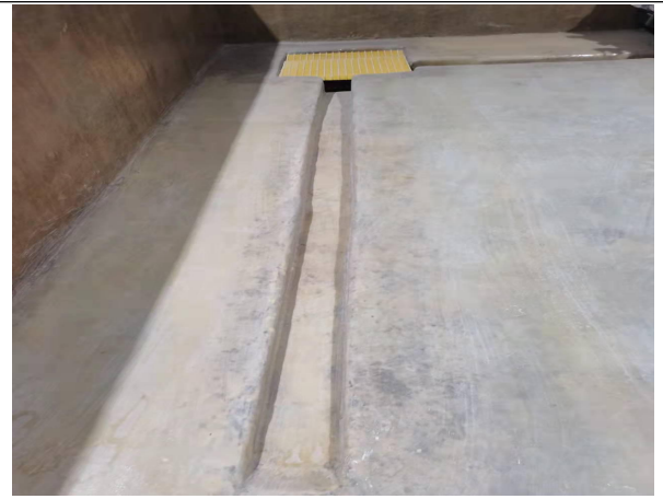
泄露导排沟及收集槽