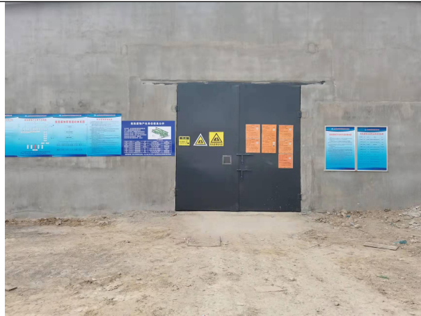
危废库门口环保标识及管理制度