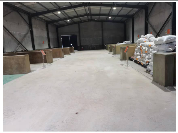
危险废物分区集中存放